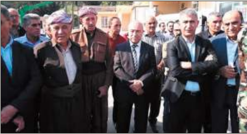
لجنة اعلام منظمة دوميز - pdk-s