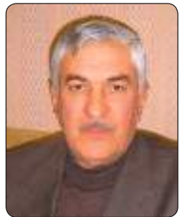
صبحي ساليه يي

رسالة الرئيس البارزاني جلبت الإنتباه وأثارت الإهتمام، ولكن ليس من قبل الرئيس الأمريكي، بل من قبل المدافعين عن حقوق الإنسان والحريصين على الأمن والإستقرار في المنطقة والعالم، عبر