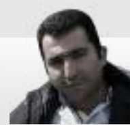
هنر بهزاد جنيدي