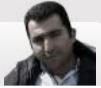
هنر بهزاد جيندي