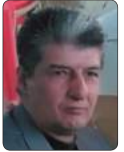
عبد الرحمن حبش

بمعسكرات سوريا في لبنان وايران والعراق وبدعم من هذه الدولة لضرب الثورة الكوردية في العراق وإخمادها ومنع أي ثورة كوردية في الأجزاء الأخرى..