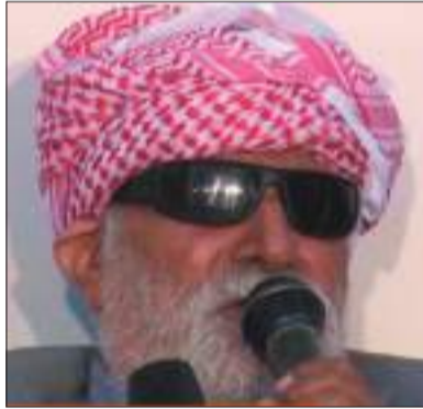
كوردستان - لافا محمد

توفي الفنان الشعبي عبد القادر بن حسين علي المعروف باسم "حافظ كور" الجمعة ٧-٨-٢٠٢٠، في بلدة سروج. ولد الفنان الراحل حافظ كور في مدينة كوباني عام ١٩٤٠، وهو فاقه للبصر، ورافق الفنانين الكرد القدامى في المدينة أمثال باقي خدو، محمد دومان ومشو بكابور.