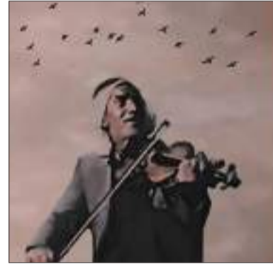
كوردستان - زافين أسماعيل

فقدت مدينة كوباني بغربي كردستان يوم ٥ آب ٢٠٢٠، أحد أعمدة الفن الكردي، وأحد أشهر عازفي آلة الكمان، محمد دومان عن عمر يناهز ٩١ عاماً.